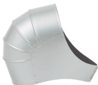
板取エルボカバー