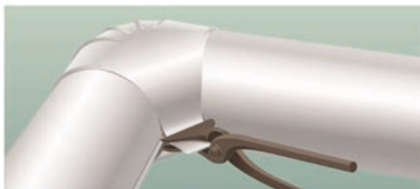
① コーナ部に合わせベロにあら折りする。