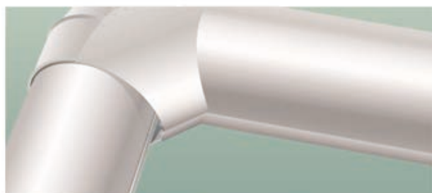
③ 上側を延ばし、内側に折り、下側は外側に折り装着する。