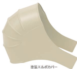
塗装エルボカバー