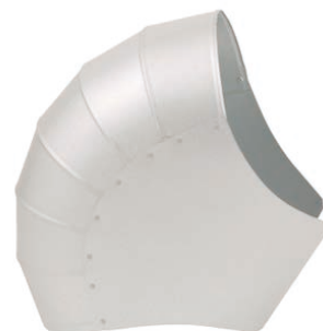
ロングエルボカバー