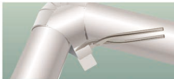
② 片側折り返し部のかみ合わせ巾を見て切り捨て 反対側を倍の巾で切り捨てる。